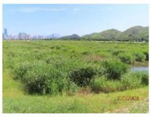
落馬洲河套地區發展

在2021/22年，本署在附設種植工程的大型基建項目中（包括啟德發展計劃一啟德機場北面停機坪的基礎設施、將軍澳跨灣連接路及落馬洲河套地區發展的前期工程等），種植了約42萬棵植物。