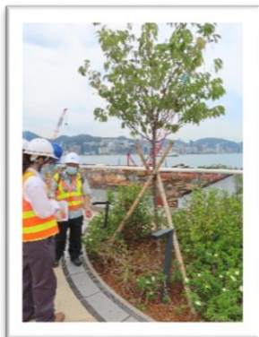
年度樹木風險評估及管理中的樹木檢查和審核