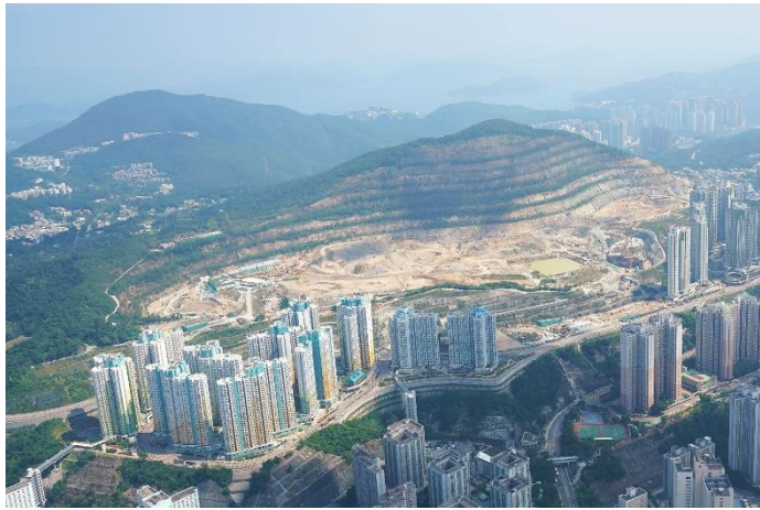
已修復的安達臣道石礦場一景