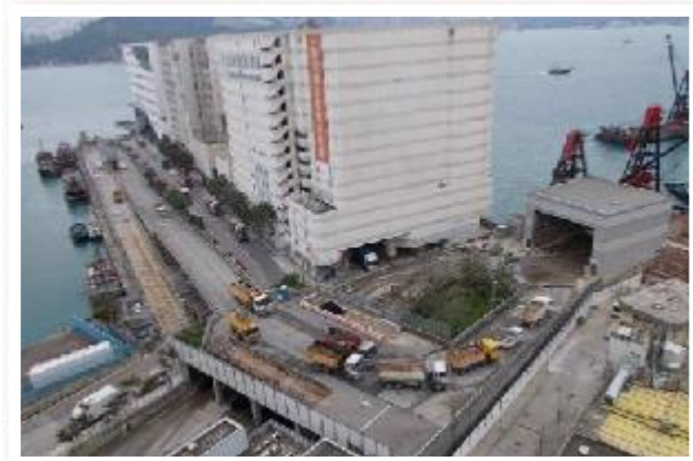
柴灣躉船轉運設施