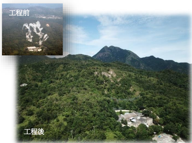
天然山坡組冠軍。工程團隊成功把斜坡工程融入大自然，令原本灰濛濛的斜坡變回綠油油的天然山坡。

榮獲「天然山坡」組別冠軍的項目利用「土壤生物工程」來設計及改善天然斜坡。由於位於西大嶼山上羌山的天然山坡發生過多次山泥傾瀉，進行過緊急的鞏固工程，以致留下約4千5百平方米的噴漿面疤痕，故工程團隊先要移除斜坡上的噴漿面，然後按斜坡的地質環境，採用不同的方法來緩減山泥傾瀉的風險。「土壤生物工程」不只是栽種植物這麼簡單，亦衡量了生物多樣性，是一種集自生、天然及美觀的山坡管理方法。此外，工程項目有創新的可持續特色，例如把現場被移除的噴漿混凝土，用作碎石排水道，避免產生拆建物料。