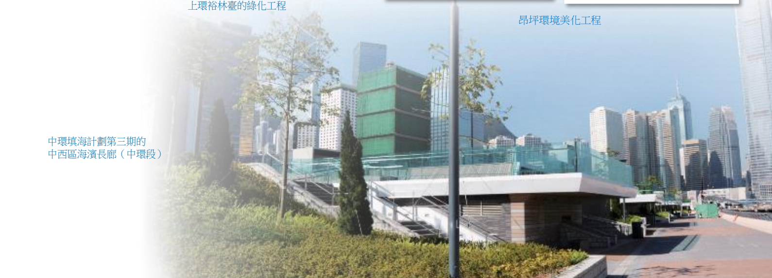
中環填海計劃第三期的 中西區海濱長廊（中環段）