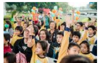
綠化總綱圖種植典禮