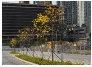
啟德發展計劃 - 啟德機場北面停機坪的基礎設施