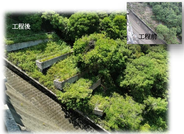
人造斜坡及擋土牆組冠軍。圖為九龍副水塘水壩旁斜坡工程前後的變化。

榮獲「人造斜坡及擋土牆」組別冠軍的項目採用了「梯台式種植牆」的設計概念來鞏固斜坡，除了在斜坡底部安裝泥釘，也在中間至頂部採用探井挖掘及灌注混凝土的方法，以建造一層層的種植牆，提供空間栽種植物，鞏固整個斜坡之餘，亦提高斜坡的生物多樣性。此外，斜坡位於九龍副水塘水壩旁，水壩具90年歷史，屬於二級歷史建築物，「梯台式種植牆」的方法可減低施工對水壩造成影響。種植牆及旁邊位置均以磚來鋪設，讓斜坡外觀與水壩外貌融為一體。