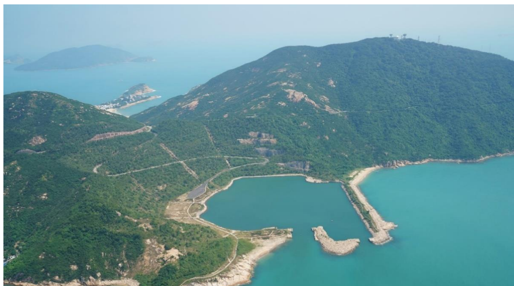
已修復的石澳石礦場一景

為確保公眾安全、可持續發展及樹木保育，本署遵從發展局綠化、園境及樹木管理組的指引，進行年度的樹木風險評估及管理工作。