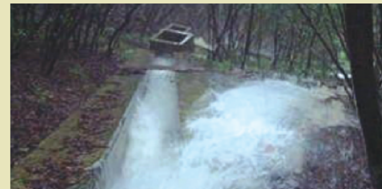
圖二 排水渠經常滿瀉或溢出