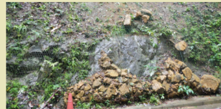
圖四 碎石被夾在金屬絲網內