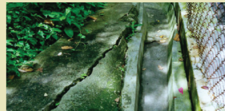
圖三 裂縫不斷擴闊